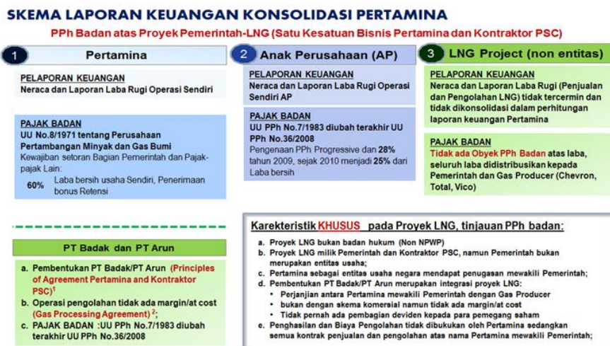
Gambar II. Skema Laporan Keuangan Konsolidasi Pertamina

Secara skema Laporan Keuangan konsolidasi Pertamina proyek LNG dilaporkan terpisah merujuk pada skema dibawah ini: