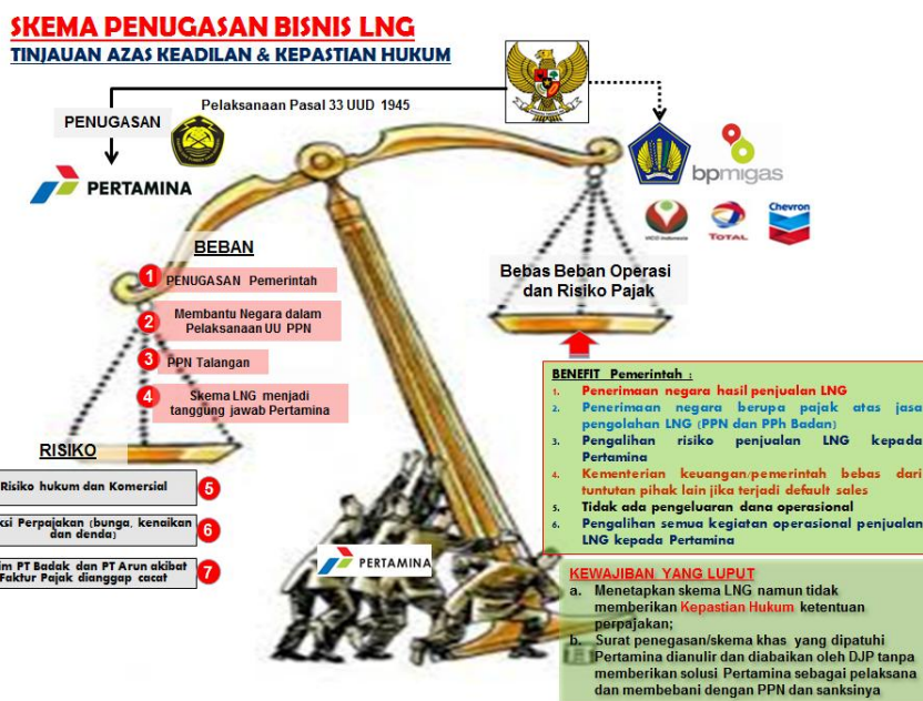
Gambar XI. Ketidakseimbangan Beban, Risiko dan Benefit Akibat Putusan Pengadilan Pajak

skema khas proyek LNG adalah peran Pertamina semata-mata sebagaibentuk Penugasan Pemerintah dengan kondisi di luar kuasa Pertamina yang telah disetujui sendiri oleh Dirjen Pajak-Termohon Peninjauan Kembali (semula Terbanding) melalui Surat Dirjen Pajak Nomor S-1936/PJ.51/1992 yang sampai dengan sekarang surat tersebut belum pernah dicabut. Adapun atas implementasi Surat Dirjen Pajak Nomor S-1936/PJ.51/1992 tidak pernah ada koreksi hingga Tahun 2013. Skema Penugasan LNG berdasar tinjauan Asas keadilan & kepastian hukum menunjukkan ketidakseimbangan beban, risiko dan benefit akibat putusan Pengadilan Pajak sebagaimana gambar berikut: