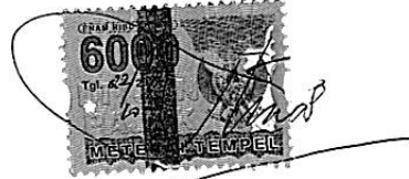
Ny. Hj. ISMIATI, SH.M.Hum