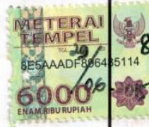
SUNDUS RAHMAWATI, S.H