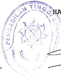
I MADE TJAKRA, SH