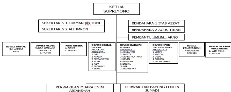
STRUKTUR JI KONSUL T3 PALEMBANG DENGAN COVER YAYASAN BINA QOLBU