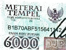
MORINDRA KRESNA, SH