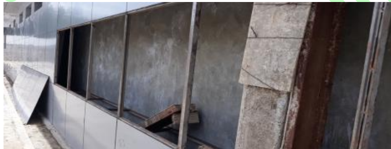
Gambar :Terlihat dinding eksterior tidak terlapisi cat dinding 3.