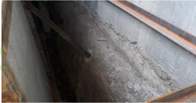
Gambar Terlihat bagian pondasi yang tidak dipleseter