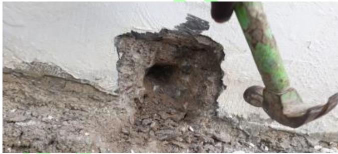
Gambar 13. Bagian sloof pagar yang tidak ditemukan tulangan baja