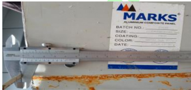
Gambar Pengukuran ketebalan coating PVDF lembaran ACP