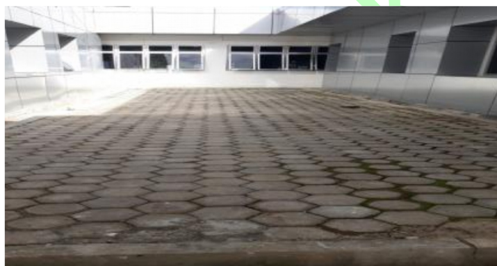
Gambar Area yang seharusnya terbangun taman hias Tidak ditemukan pekerjaan taman hias

Halaman 336 dari 414 Putusan Nomor 6/Pid.Sus-TPK/2022/PN Kpg