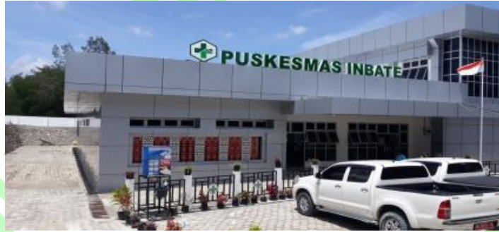
Gambar Tampak depan bangunan puskesmas 2.