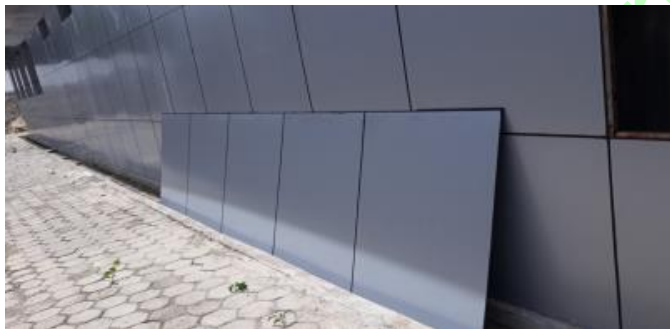
Gambar Terlihat penggunaan sealent tidak pada tempatnya