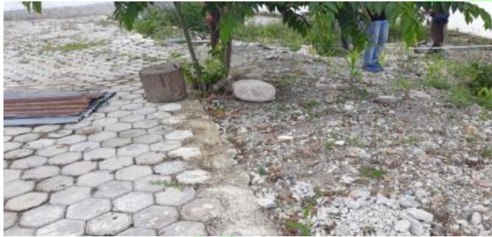
Gambar Terlihat bagian beton pengancing (kansteen) pasangan paving block yang dikerjakan secara asal – asalan.