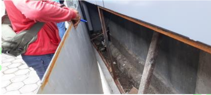
Gambar Tampak rangka ACP dari jenis besi siku dengan kondisi berkarat