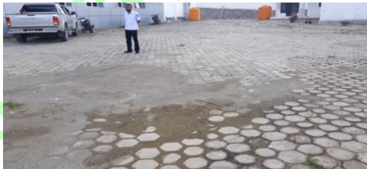
Gambar Sebagian paving block sudah rusak, permukaan tidak rata.