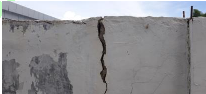
Gambar Cacat retak dinding pagar sebagai akibat tidak terpasangnya tulangan baja pada komponen sloof dan ringbalk 4.