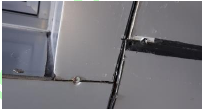
Gambar Terlihat skrup untuk menggantung ACP ke rangka besi siku