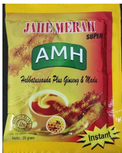
(Gambar kemasan produk milik Tergugat);