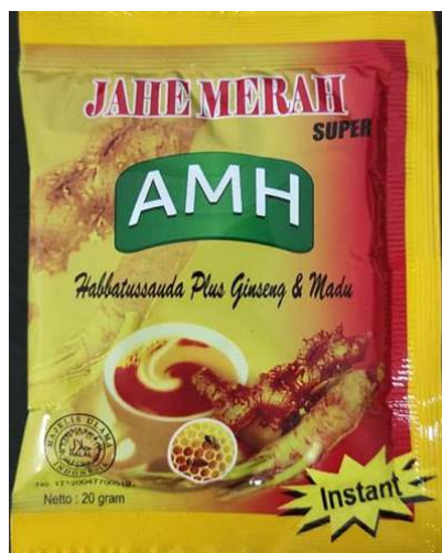
(Gambar kemasan produk milik Tergugat);